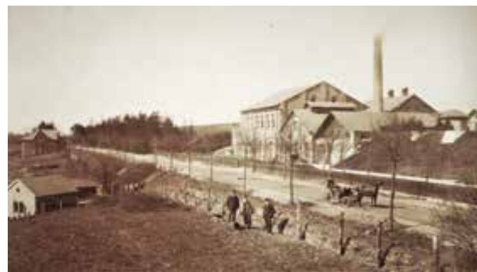
Seit mehr als 135 Jahren in Betrieb: das Wasserwerk Schulensee an der Hamburger Chaussee.

Und die Stadtwerke Kiel sorgen weiter vor: Zuletzt errichtete der Versorger zwei neue Brunnen, aus denen das Grundwasser gefördert und im Wasserwerk Schulensee in einem rein natür-